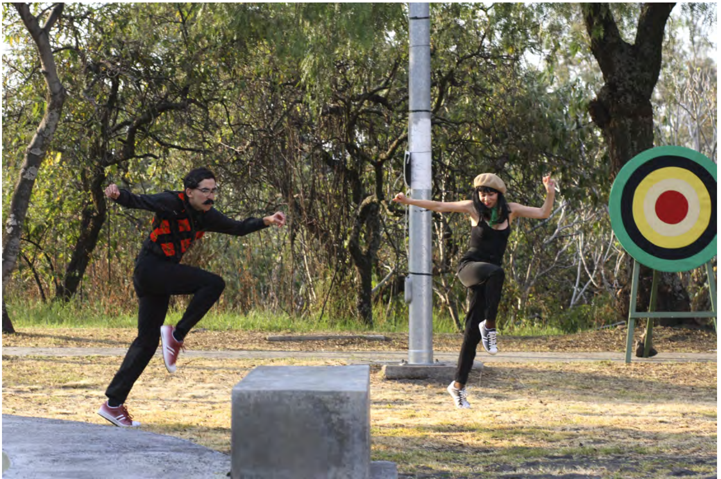
Coreografía Feliz cumpleaños Wanda June!!!, Mitrovica, 2013.