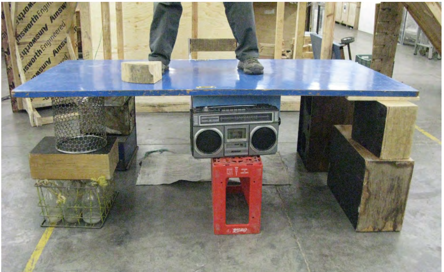
Abraham Cruzvillegas, Autoconstrucción , 2010

de_sitio - es una plataforma sin ánimo de lucro ni sede fija, dedicada a la conceptualización, desarrollo y promoción de proyectos de arte contemporáneo. de_sitio busca expandir las posibilidades de colaboración en distintos contextos con diversas organizaciones e individuos con la intención de propiciar un intercambio continuo y consistente en el desarrollo de ideas e investigaciones concretas que se compartan en formatos distintos como publicaciones, residencias, exposiciones y otros programas públicos. Enfocándose en el proceso de trabajo, de_sitio es una plataforma flexible y crítica, que da prioridad a proyectos que se desarrollan en diálogo.